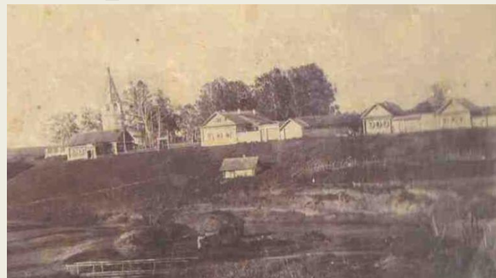
Первая церковно-приходская школа была открыта в 1869-70 г.г.