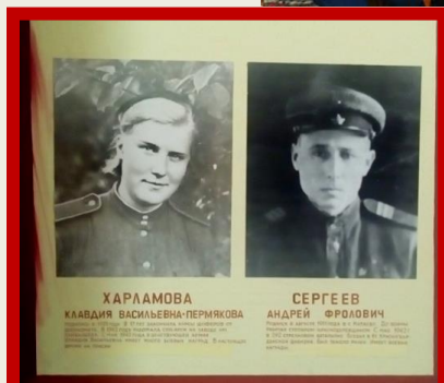
Проектная деятельность «Моя семья в годы Вов»